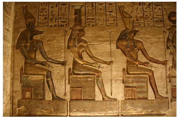
Luxor – im Tempel von Deir el Medine

Besichtigungen von Kharga: Archäologisches Museum, Hibis-Tempel, Tempel von Nadura, Nekropole Bagawat, Klosterruine Ain Mustafa Kaschif; Felszeichnungen von Gebel et-Teir. Danach Fahrt auf einer gut ausgebauten Wüstenstraße nach Luxor. Übernachtung im Iberotel am Nil. (300 km)