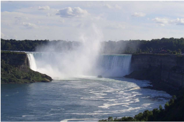
Die kanadische Seite der Niagarafälle