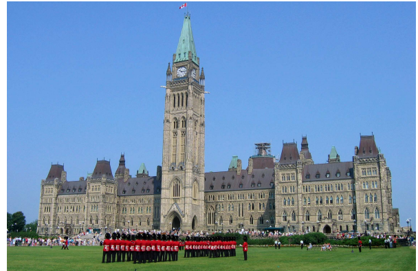
Ottawa – Wachablösung vor dem Parlament