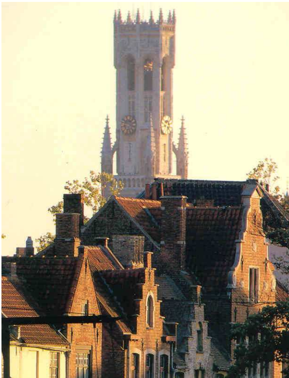
Brügge – Blick auf den 83 m hohen Belfried

Das Profil der Reise: Mit Lufthansa direkt nach Brüssel – organisierter Bustransfer nach Brügge – gutes Hotel in zentraler, ruhiger Lage – Mahlzeiten in ausgewählten Restaurants – Ausflüge nach Gent, Damme und Antwerpen.