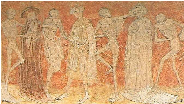
La Chaise-Dieu – das berühmte Totentanzfresko

Das Profil der Reise: Eine Fortsetzung der erfolgreichen Reise durch das nördliche Burgund 2011 – mit Lufthansa von Frankfurt und München nach Lyon und zurück – vier Hotelstandorte ermöglichen kurze Tagesetappen – bedeutende Stationen des Pilgerwegs nach Santiago.