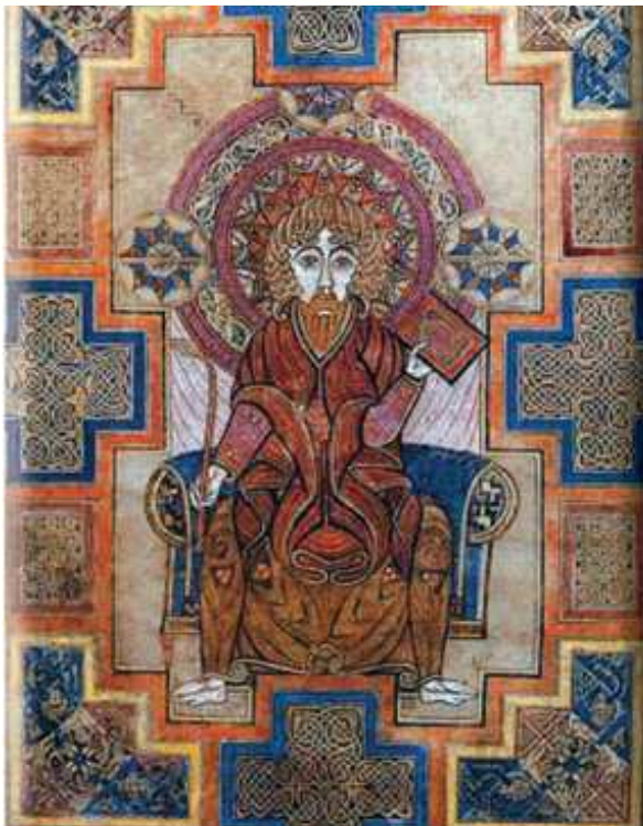
Book of Kells

Das Profil der Reise: Mit Lufthansa von Frankfurt nach Dublin und zurück, Anschlussflüge – ausgewählte 3- und 4-Sterne-Hotels mit mehrtägigen Aufhalten – Irland wo es am schönsten ist, einschließlich der eindrucksvollen Nordküste (Nordirland)