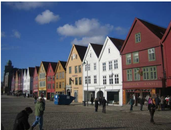
Bergen – Symphonie in Holz

Das Profil der Reise: Linienflüge nach Oslo – traditionsreiche, sehr gute Hotels mit zum Teil legendären Restaurants – Rundfahrt im bequemen Reisebus – zweistündige Kreuzfahrt auf dem Sognefjord – Norwegen wo es am schönsten ist.