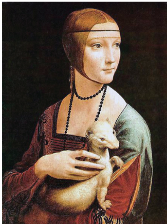
Dame mit dem Hermelin – Leonardo da Vinci

Eine Mailänder Bruderschaft bestellte 1483 bei Leonardo ein Altarbild, die miraculöse „Felsgrottenmadonna“, von der es zwei Fassungen gibt: die frühere in Paris und eine spätere in London. Die Version im Louvre, noch ganz erfüllt von dem zarten Naturalismus, der Frische und bezaubernden Anmut seines frühen Stils, hat Leonardo wahrscheinlich noch in Florenz gemalt und als Probe seines Könnens nach Mailand mitgenommen. Tatsächlich wünschten sich seine Auftraggeber eine „Kopie“. In der formbewussteren Londoner Fassung mit ihrem wächsernen Chiaroscuro hat das Bild etwas von seinem Geheimnis verloren. Der Vertrag war 1506 immer noch nicht erfüllt; es kam darüber zu Querelen, so dass man die Vollendung schließlich einem anderen Maler übertrug, aber manche Partien sind auch jetzt noch nicht über die Untermalung hinausgekommen.