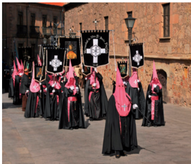
Semana Santa

02.03. - 11.03. Der Golf von Neapel im Frühling Prof. Dr. Jochen Zink Mit Aufenthalt in Neapel, Pompeji und Ravello € 2390 03.03. - 11.03. Die kleinen Kunststädte der Toskana Dr. Jochen Schütze San Gimignano, Siena, Lucca, Pisa, Arezzo, Prato, Volterra € 1990