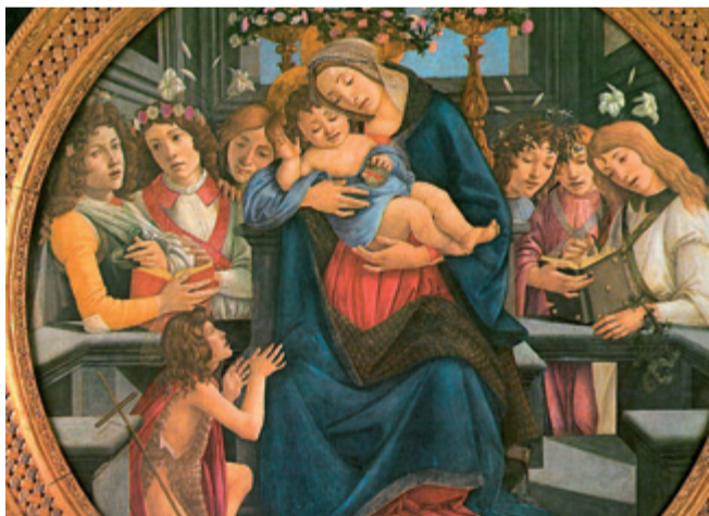
Madonna mit Kind – Botticelli

Sein erhaltenes malerisches Werk ist dem Umfang nach schmal, keine zwanzig eigenhändig ausgeführten Gemälde kommen zusammen. Um so gewaltiger ist der Bestand an Zeichnungen, obgleich auch hier schmerzliche Verluste zu verzeichnen sind. In diesen Blättern und den Gemälden Leonardos öffnet sich ein Kosmos bildgewordener Beobachtungen, Einfälle, Gedanken, Pläne, Konstruktionen, Visionen, wie ihn die Kunstgeschichte kein zweites Mal kennt.